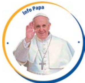
LILA ORTEGA TRÁPAGA

El Papa Francisco confortó a un grupo de niños enfermos de cáncer, recordándoles que Jesús les brinda esperanza en los momentos más difíciles, y los instó a ser "apóstoles del amor de Dios".