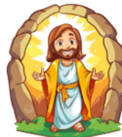
Pascua de resurrección