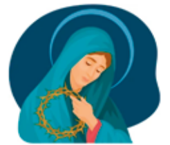
Procesión del silencio