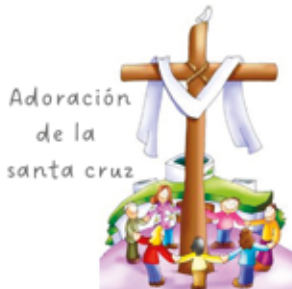
Adoración de la santa cruz