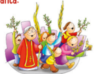
Domingo de Ramos