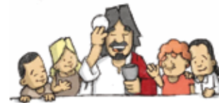
Institución de la Eucaristía