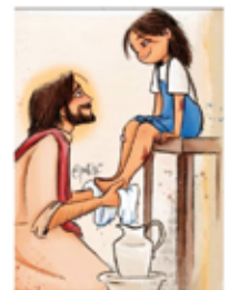
Lavatorio de pies