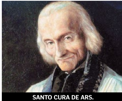
SANTO CURA DE ARS.

es lo que, como un rayo, atraviesa la oscuridad de tu alma; es lo que, en el destello de la tormenta, te levanta y te lleva a Dios".