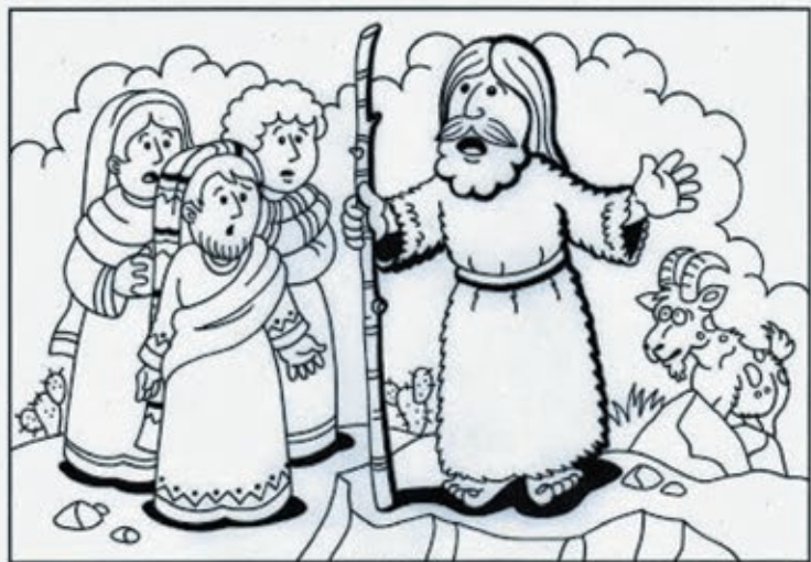
Encontramos y coloreamos en la sopa de letras la opción correcta para cada pregunta, según nos relata el Evangelio de San Mateo.

Ciclo A 2º domingo de Adviento - Mateo 3, 1-12