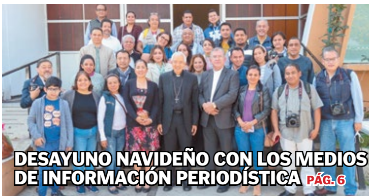
DESAYUNO NAVIDEÑO CON LOS MEDIOS DE INFORMACIÓN PERIODÍSTICA PÁG. 6

Desde los aspectos más elementales de la educación, los hijos van aprendiendo de sus padres a hacer del evangelio la norma de su vida. PÁG. 4