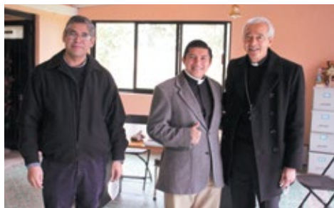
En el centro vocacional Hipólito Reyes Larios.