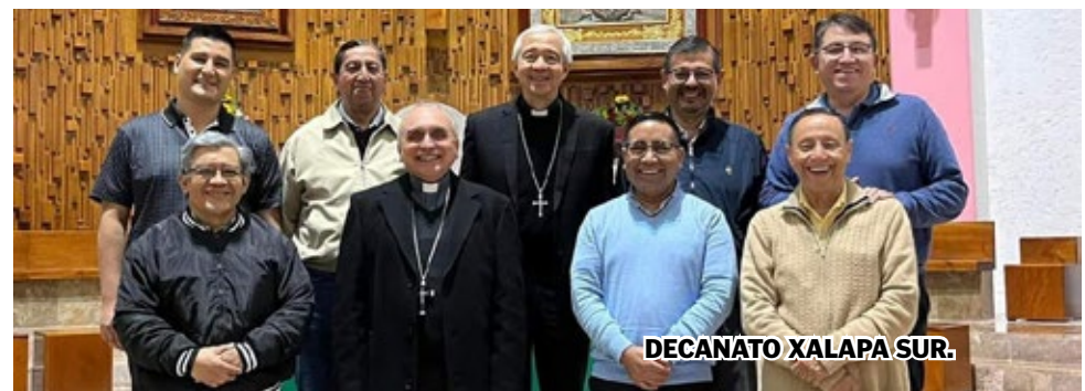
DECANATO XALAPA SUR.