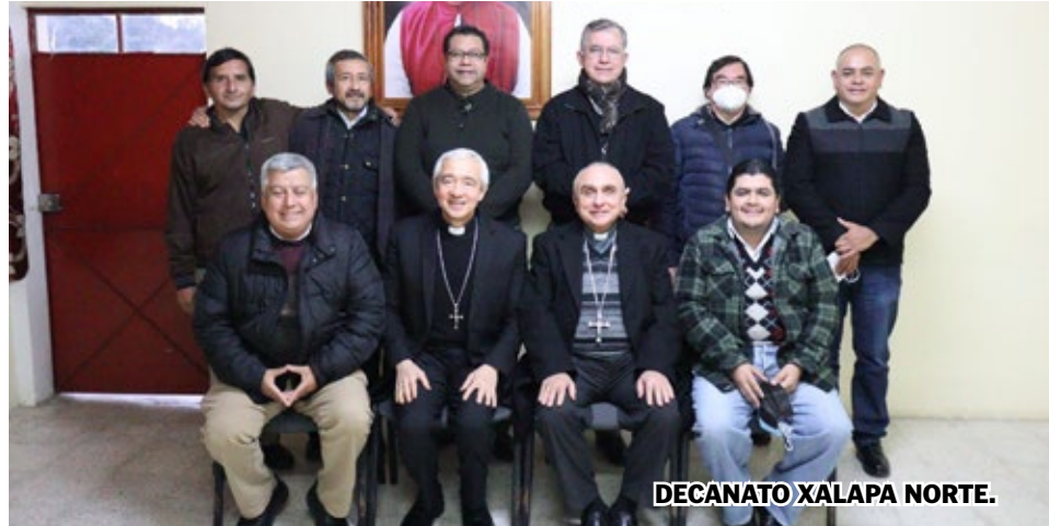
DECANATO XALAPA NORTE.

De ahí la sapiencia del prelado de encontrarse con cada uno de estos decanatos para escucharlos, conocerlos y ofrecerles un breve mensaje. Este primer encuentro entre el Obispo y sus sacerdotes resultó muy positivo, los frutos se manifestaron ya en actitudes de apertura, escucha, cercanía, diálogo y colaboración; existe un buen espíritu de comunión y obediencia al sucesor de los apóstoles. Hubo también momentos de oración, de intercambio de experiencias e información. Mons. Jorge Carlos pudo ver los rostros de cada uno