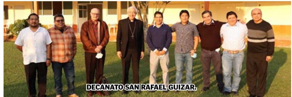
DECANATO SAN RAFAEL GUIZAR.

¡Que todo sea para la gloria de Dios, que seamos instrumentos eficaces de su misericordia y testigos permanentes de su Palabra!