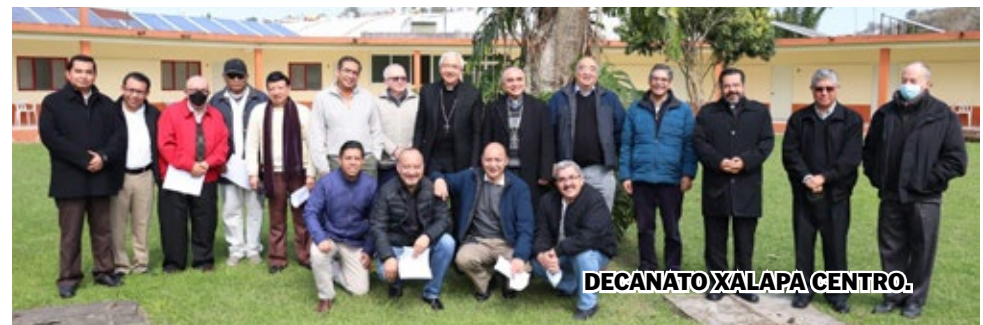
DECANATO XALAPA CENTRO.