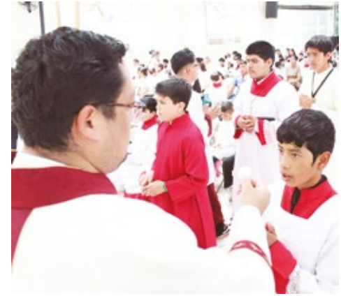
sentido de pertenencia dentro de la Iglesia diocesana.